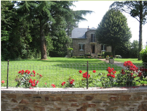
Le Masnau 12800 NAUCELLE