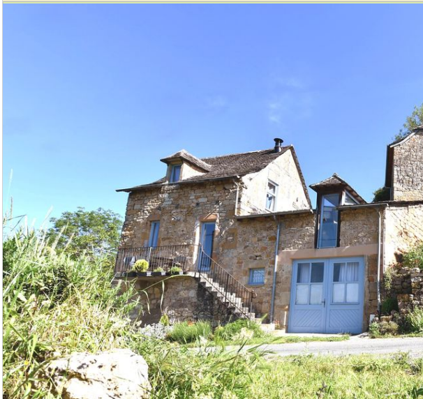
Le Gîte du peintre - Figuiès 12330 SALLES-LA-SOURCE